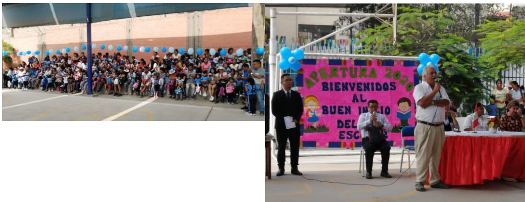
En el Colegio Parroquial Sagrado Corazón de Jesús de Jicamarca se inició el curso 2020, pero dada la situación actual, el alumnado ha sido enviado a sus hogares y el centro suspendió su actividad