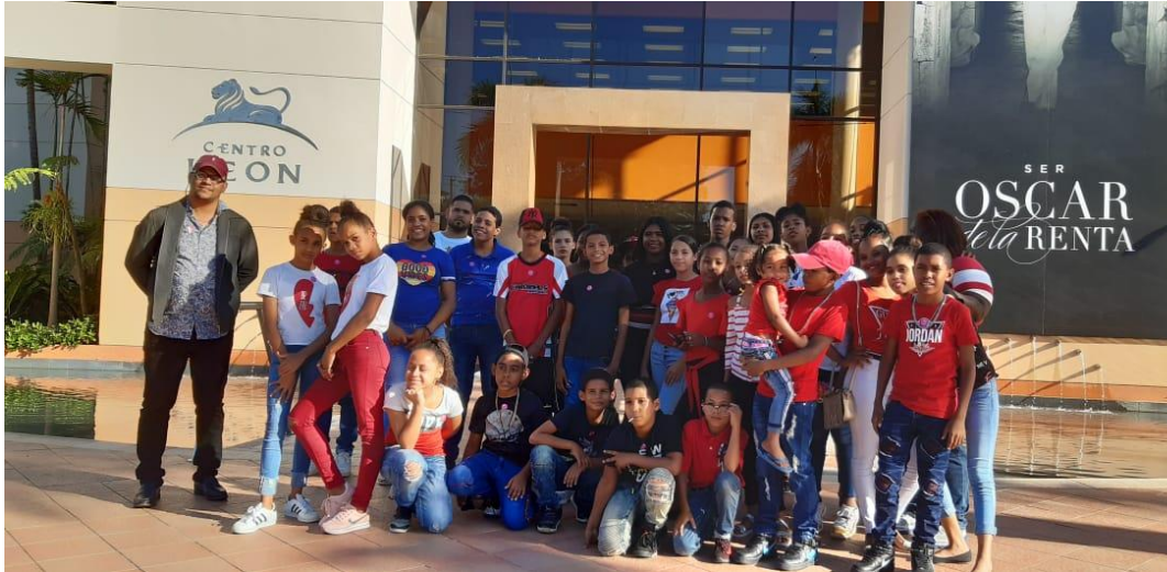
El alumnado del taller de pintura, de la Escuela de Arte y Tiempo Libre de Santa Lucía, visitó el Centro Cultural León.